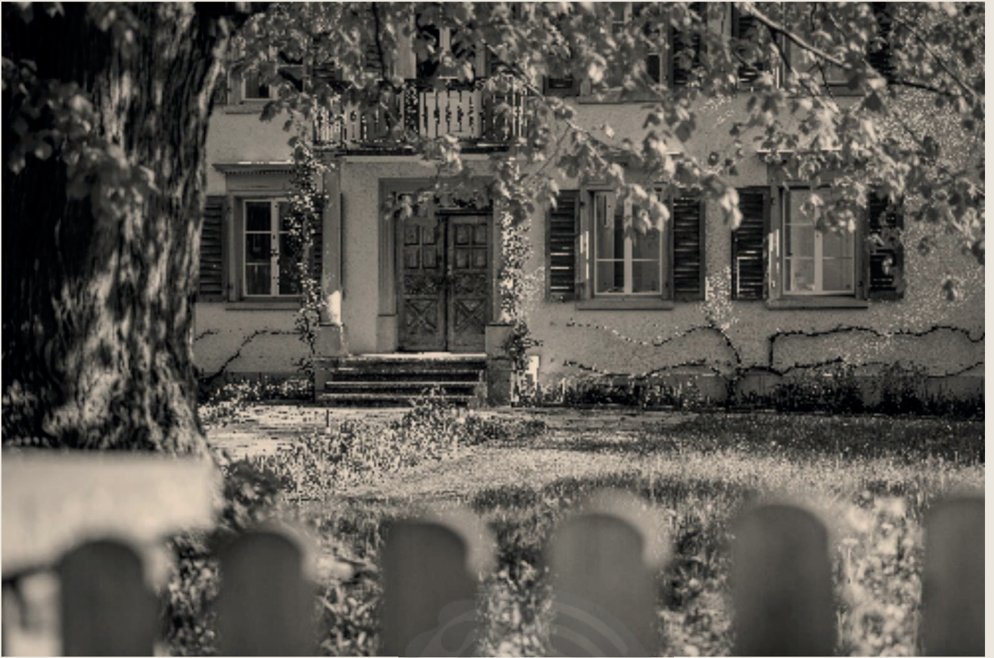
Eingang Villa Palottis