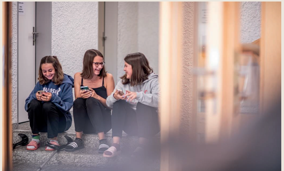
Mittagspause Schülerinnen der SBA