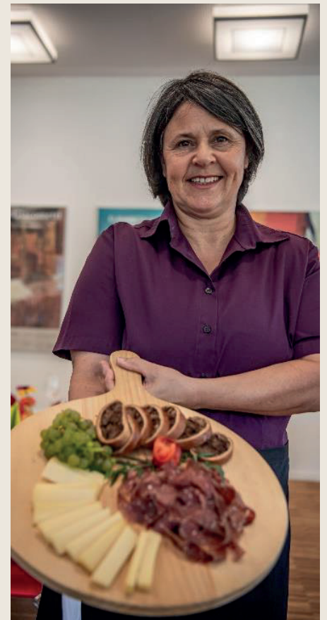
Die treue Mitarbeiterin

besteht aus 32 engagierten Mitarbeiterinnen und Mitarbeiter und wird unterstützt von zwei Teilzeitkräften mit Handicap.