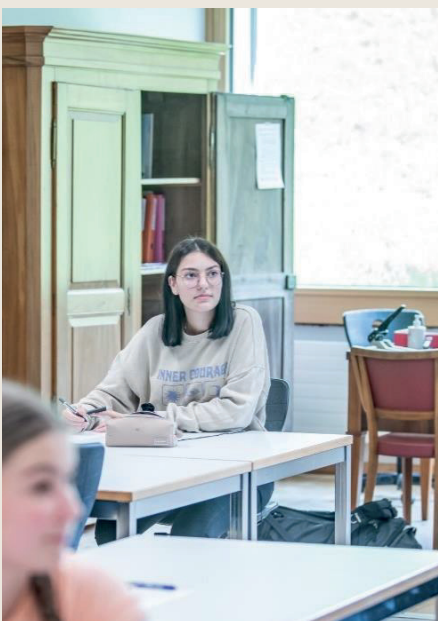
Schülerin im Unterricht