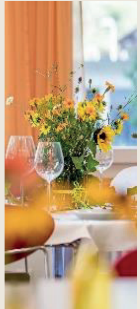
Gedeckter Tisch, bereit für Gäste