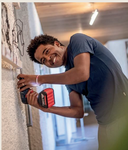
Lachender Hauswart Stv.