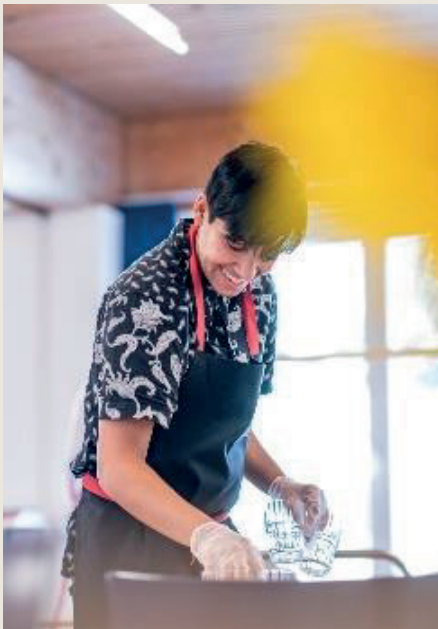
Mittagsämtli der Schüler