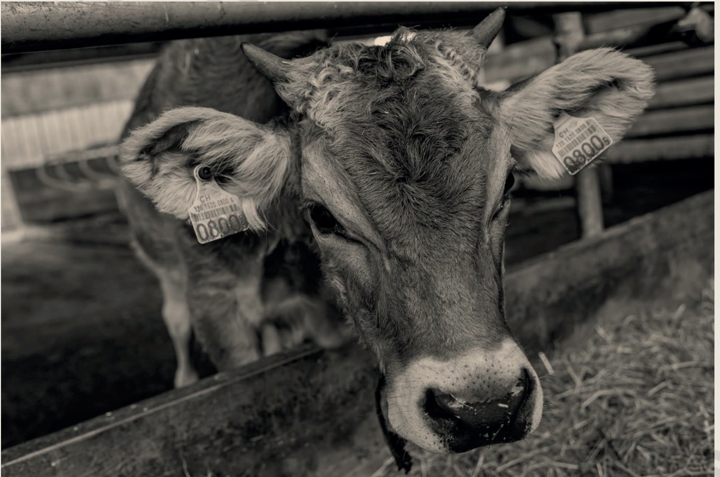
Blick in den Stall – aus dem Stall