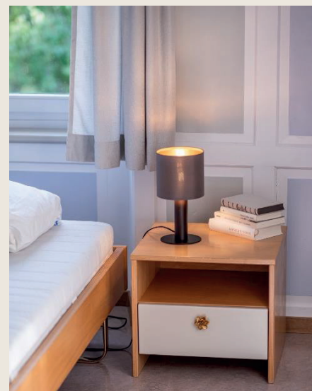
Stilleben in der Villa Palottis