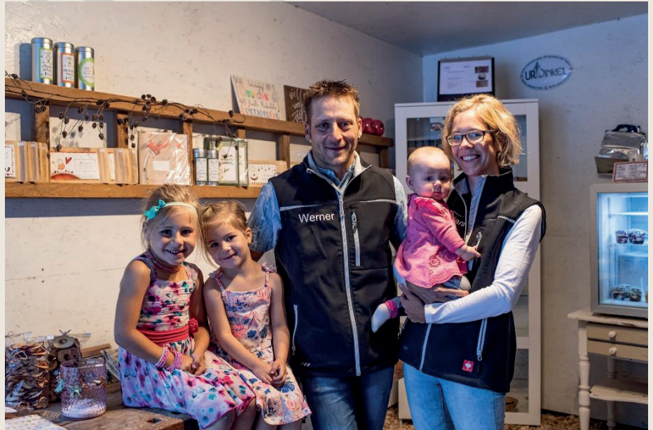
Pächterfamilie im Hoflädeli