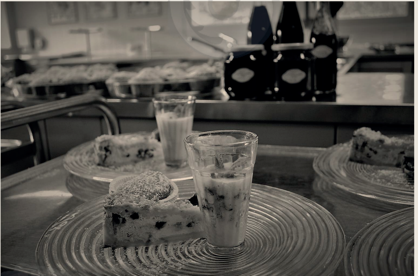
Aus der Schulküche