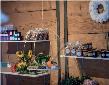
Gluschtiges im Hofladen