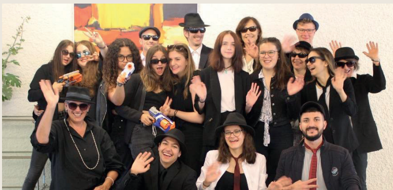
Mottotage: Blues Brothers im Palottis