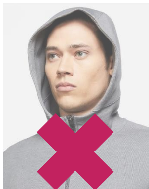
Pullover mit Kapuze